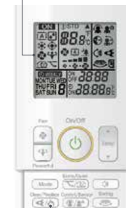
Kamina nupp juhtpuldil